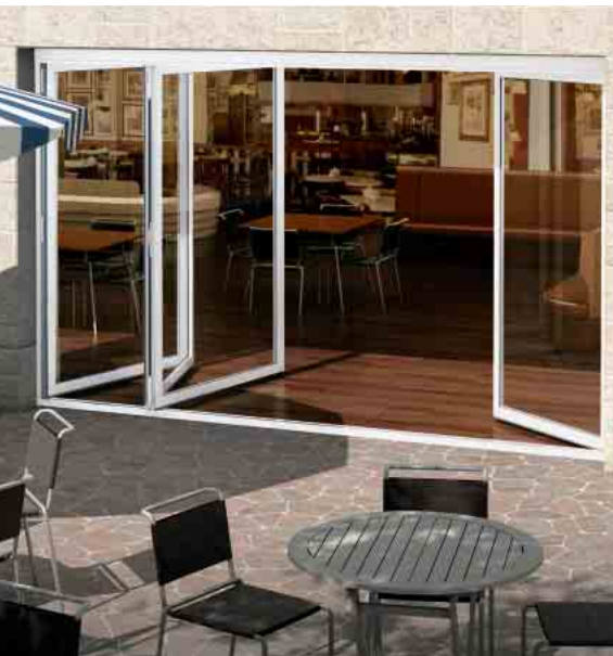
Falt-Schiebeanlage Folding/sliding units