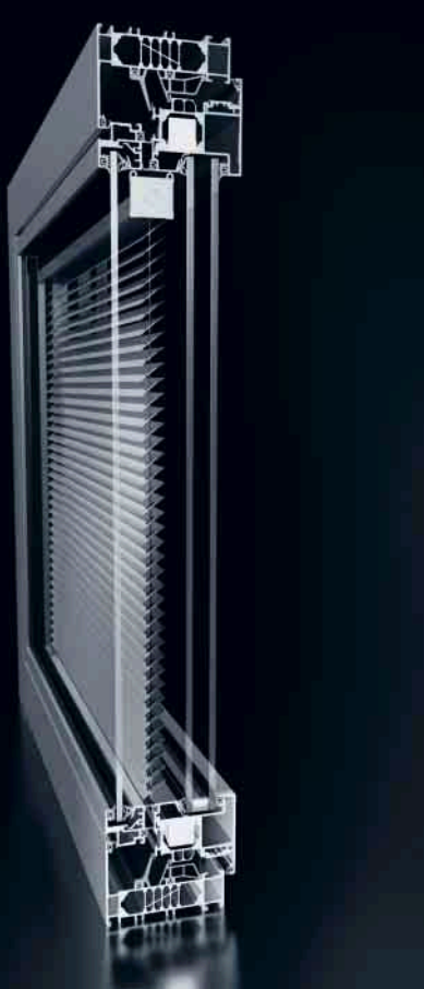
Integriert liegender Sonnenschutz Bedienung über Funkgriff Integrated solar shading Operated via remote control handle

Die Verbundfensterkonstruktion mit höchster Wärmedämmung und Schallschutz: